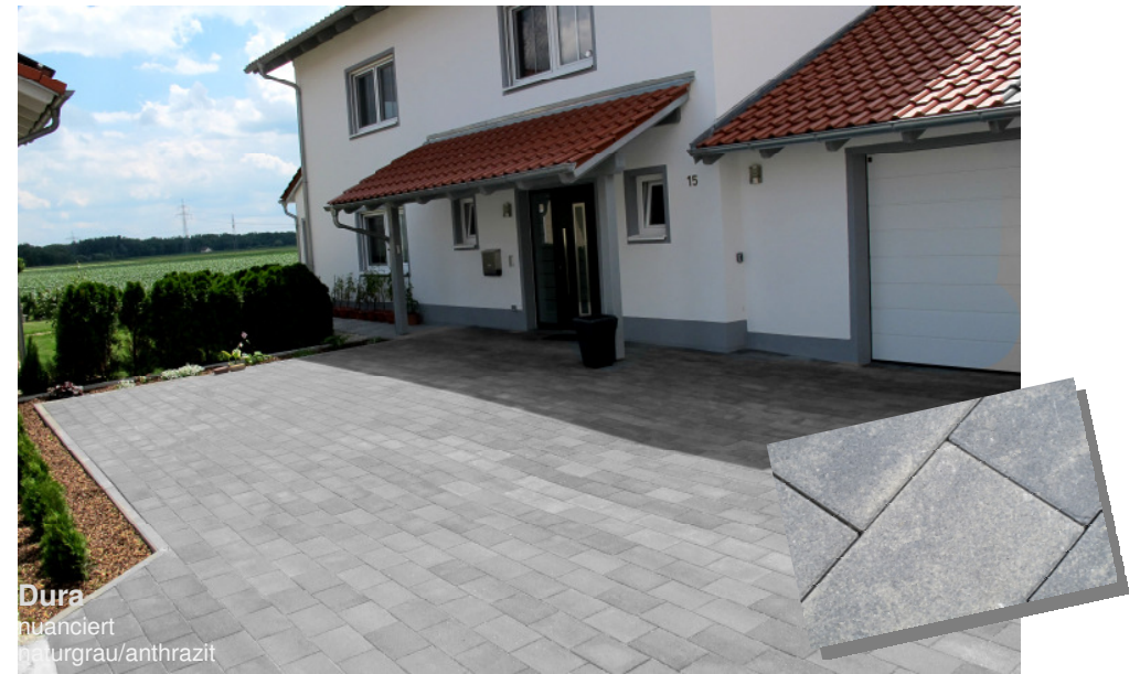
Dura nuanciert naturgrau/anthrazit