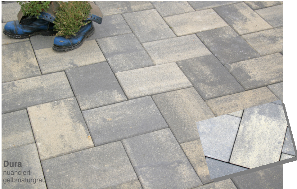
Dura nuanciert gelb/naturgrau