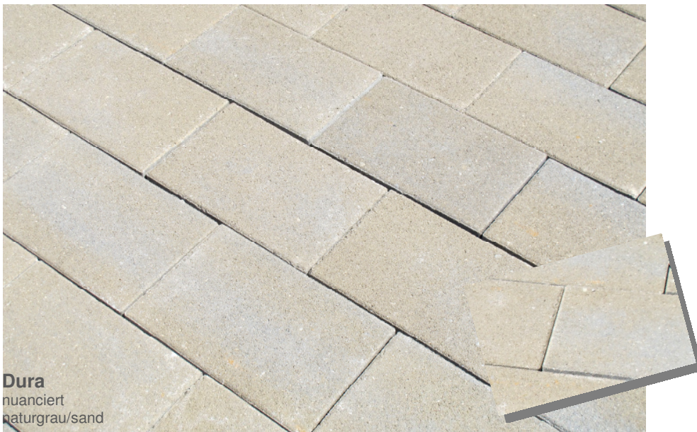
Dura nuanciert naturgrau/sand