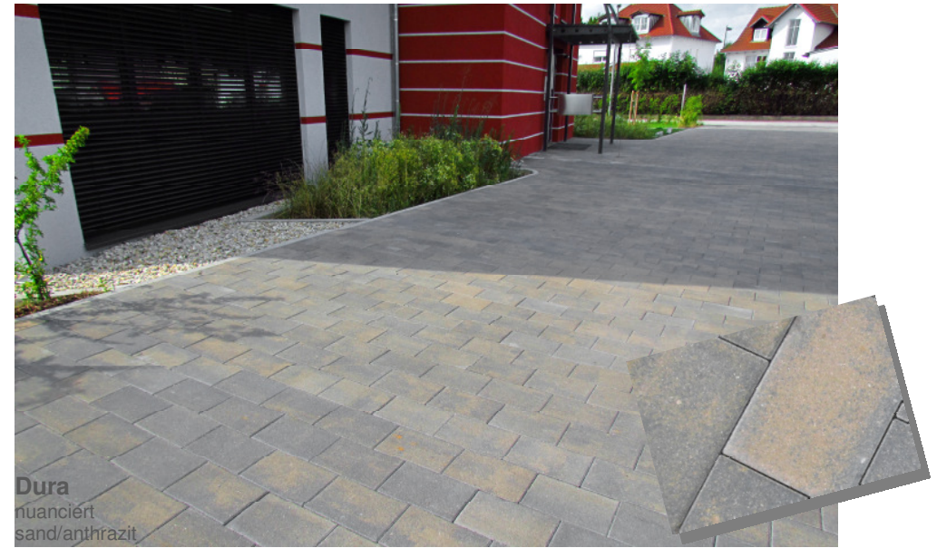
Dura nuanciert sand/anthrazit