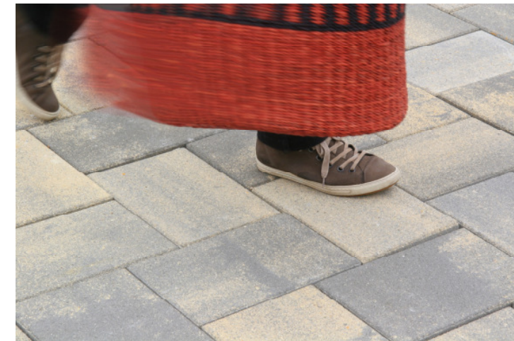
Dura nuanciert gelb/naturgrau