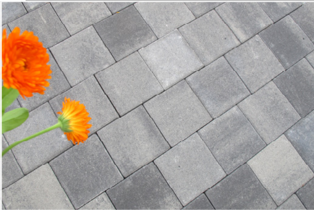
Dura 20 x 20 cm