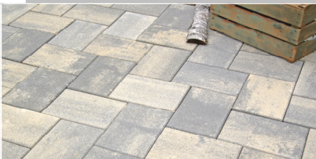
Dura 30 x 20 cm