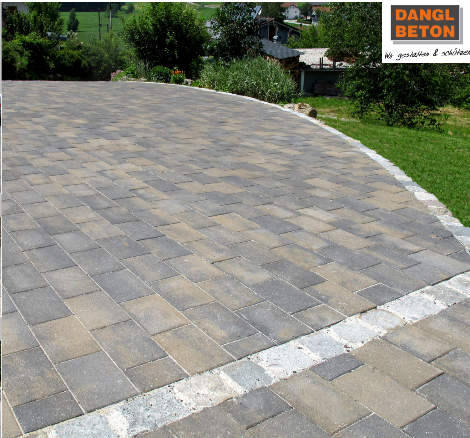
Dura 30 x 20 cm