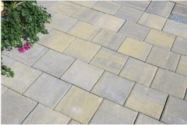
Dura 20 x 20 cm

Interessante Farbnuancen ermöglichen Ihnen Flächengestaltungen ganz nach Ihrem Geschmack. Durch die Verarbeitung von hochwertigem Quarzsand an der Steinoberseite und dauerhafte Farben haben Sie lange Freude an Ihrer Außengestaltung.