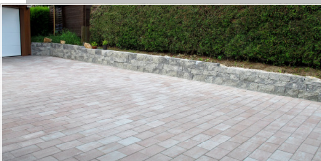
Dura 30 x 20 cm