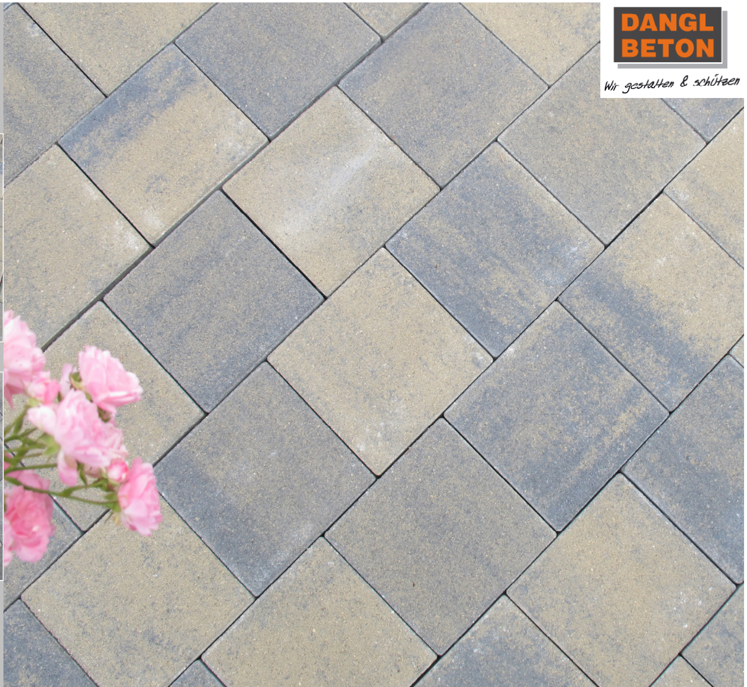
Dura 20 x 20 cm

Ausführung: Quarzsandvorsatz (Verschleißschicht) mit Minifase