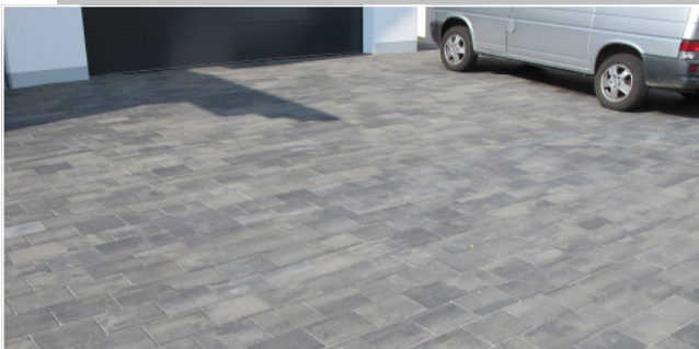
Dura 30 x 20 cm